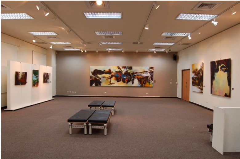
虎科大綜三館-展覽室