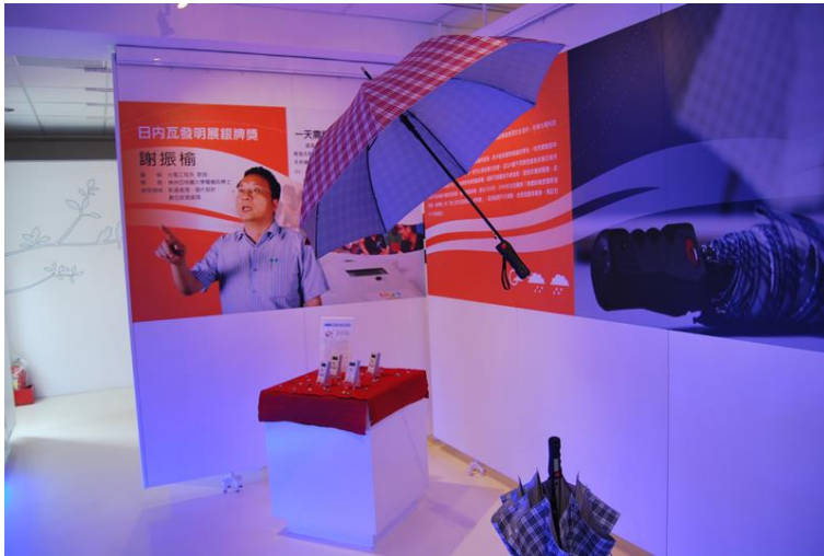
虎科大綜三館—川廊櫥窗展示